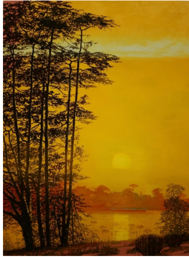
Les Ombelles Huile sur toile, 100 x 82 cm