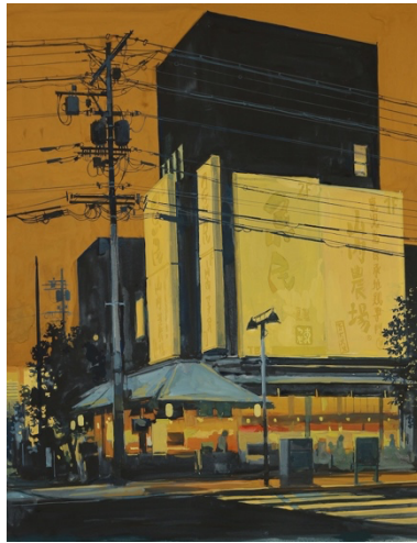
Grand Shiboya Gouache sur papier, 65 x 50 cm