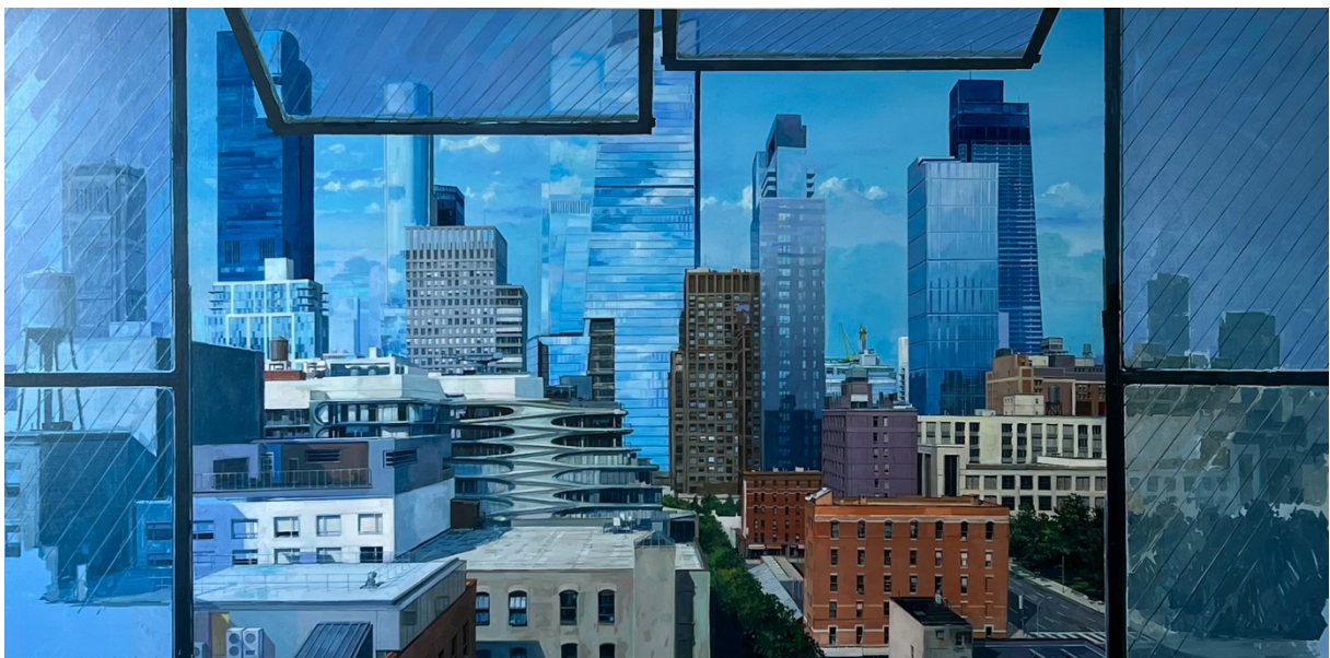
Green line Huile sur toile, 97 x 195 cm