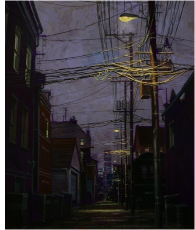
Contre-Allée Huile sur toile, 50 x 41 cm