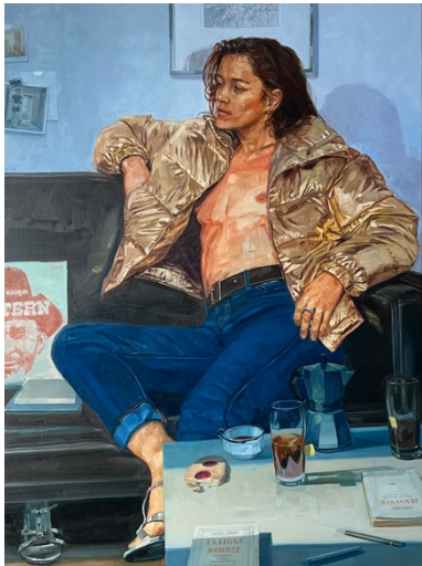
La ligne d'ombre Huile sur toile, 130 x 97 cm