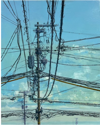
Wires Huile sur toile, 50 x 41 cm